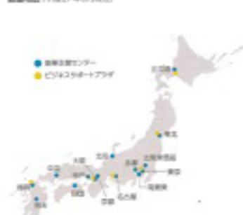
創業支援センター（平成27年6月現在）